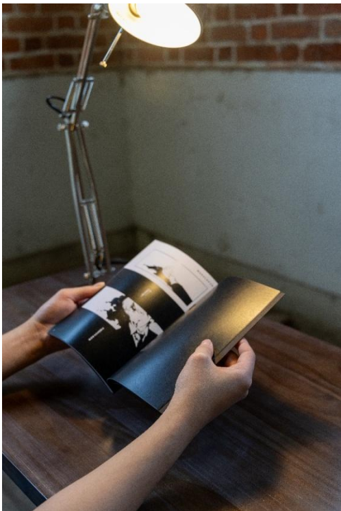
圖四：梁詩維同學的漫畫作品《一個 INFJ 的獨白》講述有人用 MBTI 或不同的人格測驗去分辨世界上不同人的性格和特質，但他卻認為每個人都是獨一無二的，是不能被介定的。