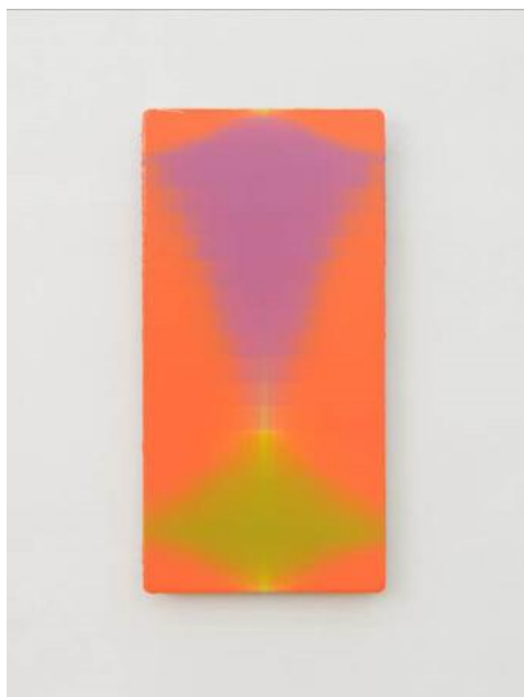
圖六：《一閃（ksana）》系列名稱取自佛教用語。藝術家挑戰硬質工業材料，營造出如同螢火般閃爍的溫潤視覺效果。