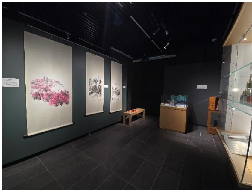
圖九：展覽地點位於香港恒生大學－基金展覽廊。此次藝術走進校園，旨在讓當代抽象藝術與學術環境及藝術市場產生有機連結。