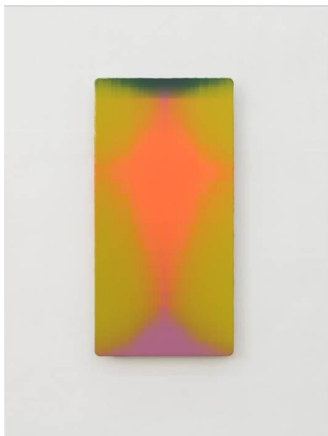
圖七：特寫鏡頭展示作品邊界的「視覺震顫」效果。透過精密的重疊工藝，將感性情緒隱藏在理性的幾何結構之下。