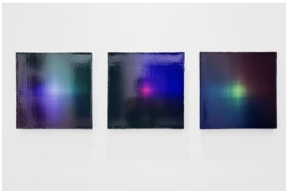
圖八：捕捉反光黑色玻璃與紅色燈泡構成的迷宮空間，以及觀者影像的折射效果。