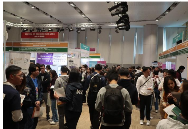
圖一至圖四：「恒生大學資訊日 2023」吸引眾多中六學生到場了解大學資訊及收生要求等。