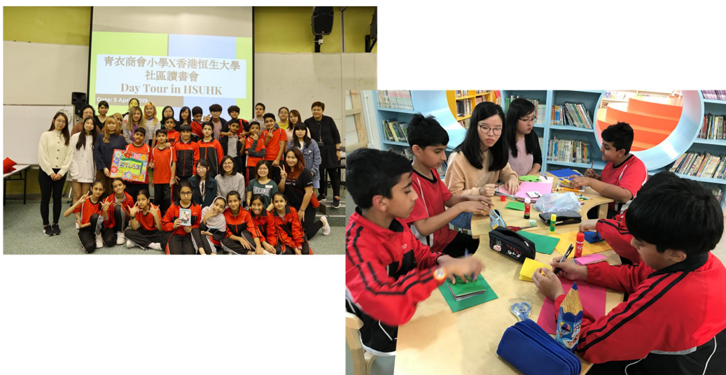
恒大學生與年輕少數族裔互動