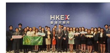
參觀香港交易所 2023年4月