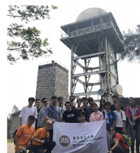
獅子山公園至蘇屋遠足遊 2018年11月