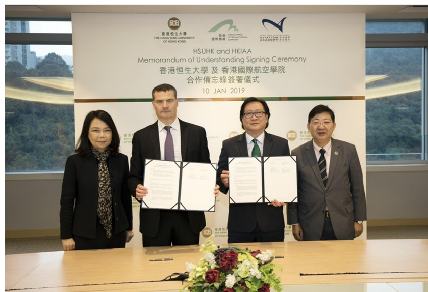
恒大及香港國際航空學院合作備忘錄簽署儀式 2019年1月10日