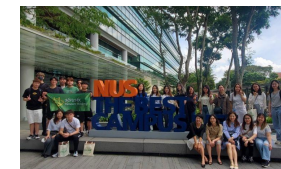
榮譽學院師生首次 到新加坡交流 2023年1月