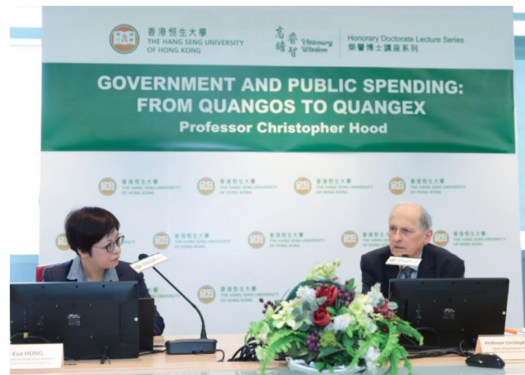
香港恒生大學榮譽社會科學博士胡德教授以「Government and Public Spending: From Quangos to Quangex」為題分享其真知灼見 2023年3月16日