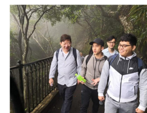
太平山到堅尼地城遠足遊 2019年4月