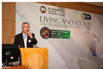
諾貝爾化學獎得主根岸英一教授 「生活與社會—社會環境問題與可持續發展」研討會 2015年10月