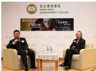
諾貝爾文學獎得主高行健博士 《美的葬禮》電影放映及座談會 2014年11月