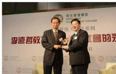
諾貝爾化學獎得主李遠哲教授 「談人類社會的永續發展」 2015年4月