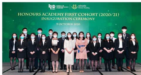
首屆榮譽學院啟動禮 (2020)