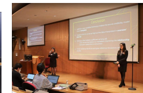
榮譽學院研討會 2023年5月 (學生展示其研究項目)