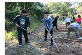
有機農耕體驗 2019年12月