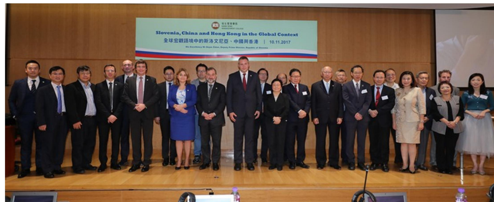
斯洛文尼亞共和國副總理兼農業、林業、食品部長戴揚·日丹 (Mr Dejan Židan) 親臨恒大就 「全球宏觀語境中的斯洛文尼亞、中國與香港」發表演講 2017年11月10日