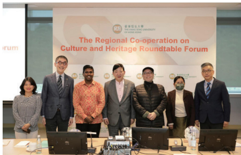
論壇探討文化與文物如何促進東盟國家與香港的相互交流與發展 2023年3月29日