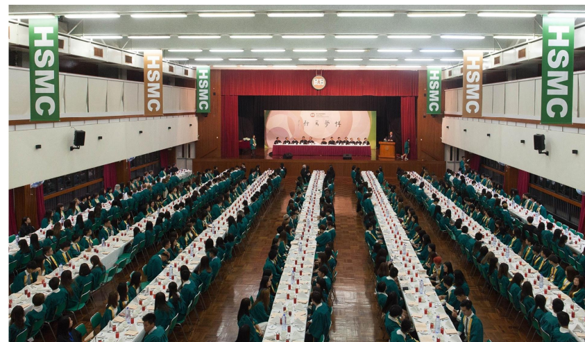
香港恒生大學賽馬會住宿書院聯合高桌晚宴 2016年