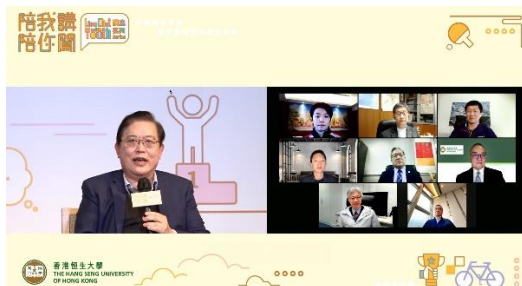
圖一：講座嘉賓及觀眾踴躍分享對本港體育發展的觀點。