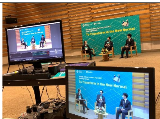
圖二：恒大舉辦多元職業博覽開幕論壇，邀得僱主與學生討論如何做好準備迎接「疫後」新常態。