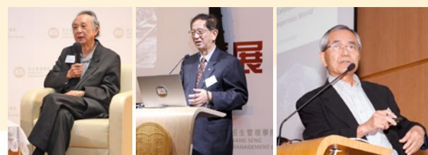
諾貝爾獎得主講座系列 （左起）高行健博士（文學獎）、李遠哲教授（化學獎）及根岸英一教授（化學獎）