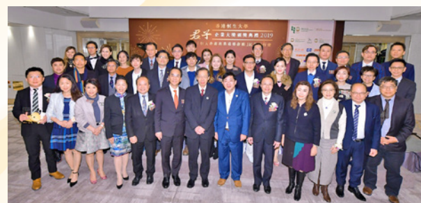
年度「君子企業計劃」及「恒大商業道德指數」