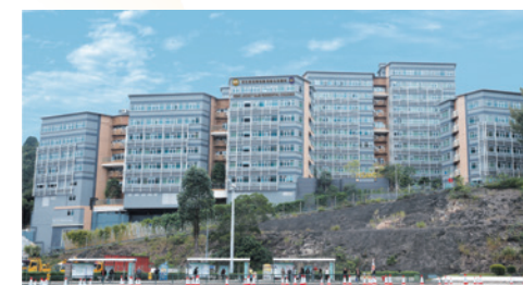
恒大賽馬會住宿書院