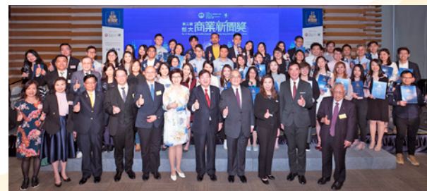
年度「恒大商業新聞獎」