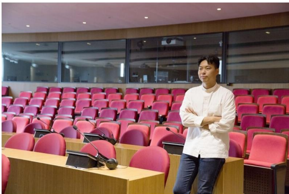
Gap表示，恒大翻譯學院課程涵蓋文字翻譯和口譯訓練，能維持他對不同語言的語感，提升語文能力。