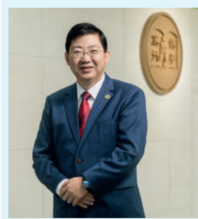
香港恒生大學校長何順文教授