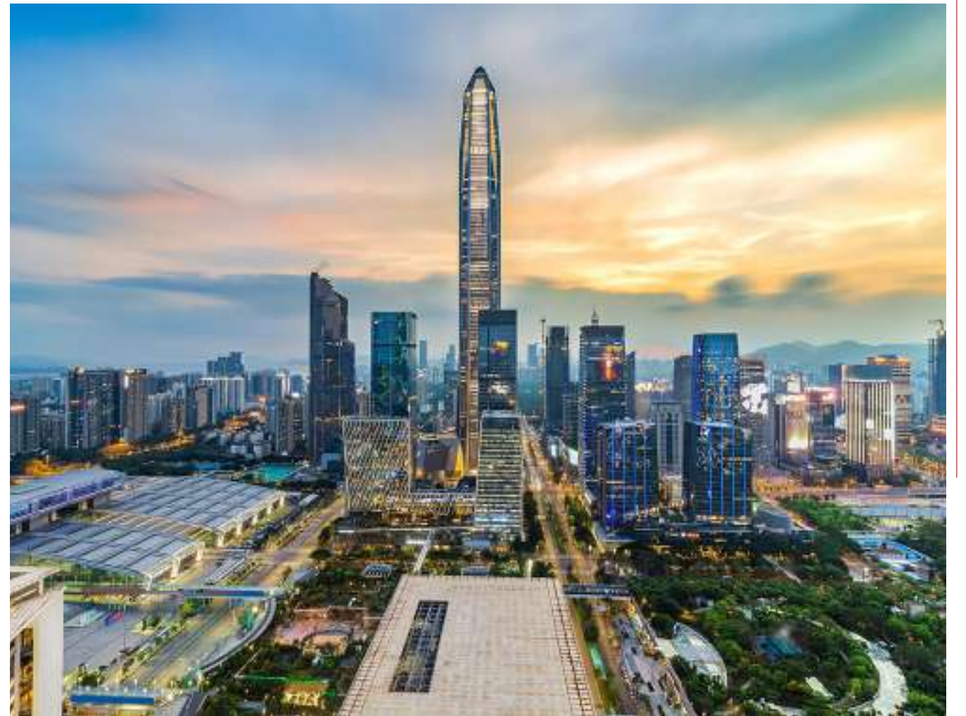
中國是全球第二大經濟體，經營者勢必要深入認識中國的新戰略、新政策機遇，方能掌握新商機。

世界政經局勢瞬息萬變，疫後營商環境挑戰巨大，經營者要如何突破障礙，掌握先機？亞洲週刊聯同香港恒生大學主辦「營商智慧及產業方略：亞洲中國視野網上證書課程系列」，邀請各領域專家學者深度剖析最新趨勢，助您在經營事業的道路上掌握機遇，創造新局。