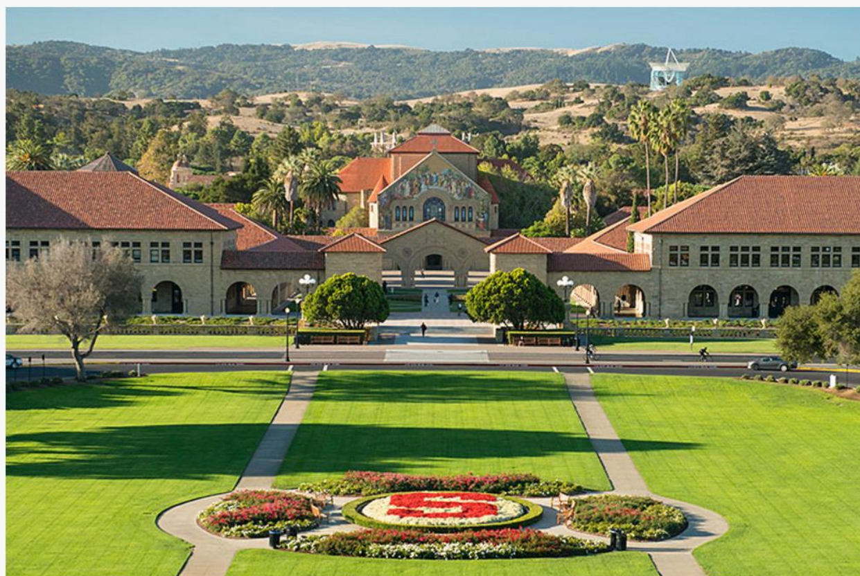
在美國和很多西方國家，私立大學的發展遠比公立大學為早及優勝。（史丹福大學）

香港長期依靠公帑資助大學，私立自資院校起步遲發展較新，私校仍難與公校在資源、聲譽與排名上作競爭，一些社會人士對私校仍欠足夠了解（甚至有些誤解與偏見）。但在美國和很多西方國家，私立大學的發展遠比公立大學為早及優勝。私大在捐獻收入、教研成就與聲譽都遠比後者優勝。在東亞地區，私立大學也成為高教的主力。在南韓排名最高的十間大學，有八間為私立；在日本，也有一半為私大。在韓日，考入私大是一個榮耀。在台灣，私大則過多及質素參差，但在十大仍有兩間私大入圍。部份私大的成就迫使當地公校不敢自滿而不斷自我提升。