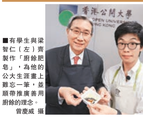
有學生與梁智仁(左)齊製作「廚餘肥皂」，為他的公大生涯畫上難忘一筆，並順帶推廣善用廚餘的理念。

香港文匯報訊(記者歐陽文情)任職公開大學校長逾10年的梁智仁，將於本月底離任。他昨日於傳媒茶敘上分享自己一直以來的心路歷程，最在意社會一直視公大為「私立」大學，最遺憾未能在任內為學生興建宿舍。離別在即，他亦講出最後的3個願望，希望公大校園能擴展至合理水平、教育局可支持所有專上學院發展、自資院校和8大院校之間有統一的質素保證機制。