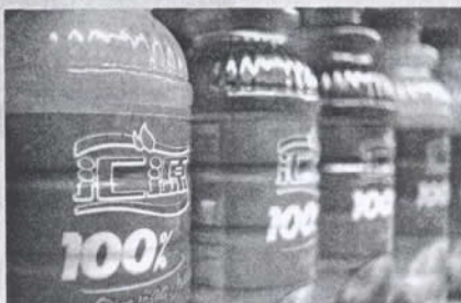
可口可樂收購藍源能否成功，取決於《反壟斷法》一關。

《反壟斷法》實施的前一天7月31日，北京中銀律師事務所並正式向商務部、工商總局、發改委發出《請求保護公民財產權益的建議申請書》，提