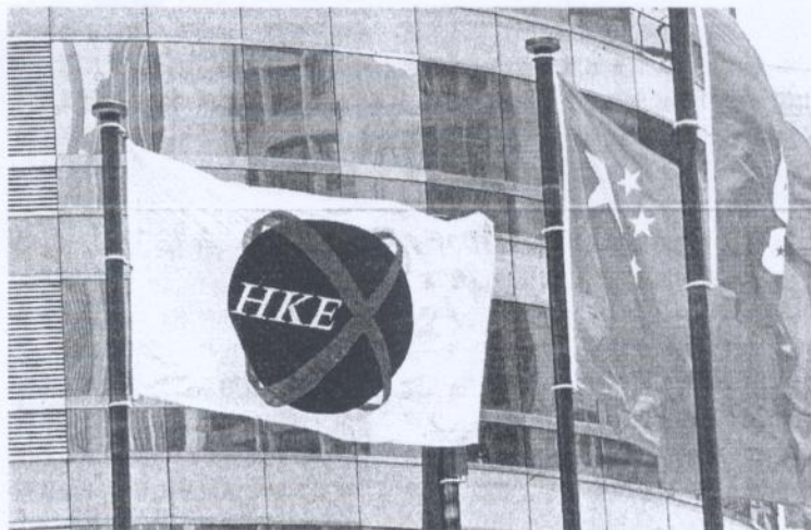
港交所的《上市公司管治守則》建議上市公司為所有董事購備適當保險，以針對對董事的法律訴訟。