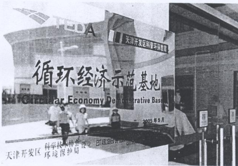
內地環保意識提升反映企業與民眾的利益衝突