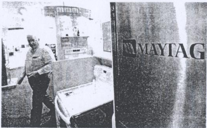
海爾收購美泰如成功，是內地企業發展的一個大突破。