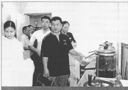
愈來愈多內地人轉入讀香港MBA課程

去年9月美國《商業周刊》發表一項有關研究的結果，利用畢業於1992年排名美國前三十名院校的一千五百多名MBA畢業生為調查對象，要求他們對其MBA學位作出評價；結果發現這些MBA校友對自己過去十年的事業發展和收入（連花紅平均年薪為三十八萬美元），十分滿意。（大部分美國本科畢業生年薪平均只有四萬五千美元。）他們大部分都