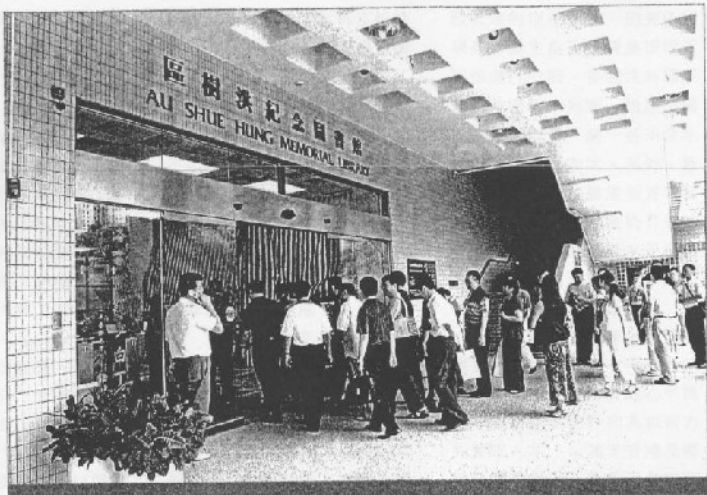
香港的大學MBA正視學額不足，不少學子爭門與歡。

本港八間大學皆受政府某種形式的資助和監管。在師資、課程設計、收生標準、教學設施以及與世界和中國聯繫有一定的嚴謹性，大多已符合國際管理協會的認可標準或在進行評審中。其中有一、兩間大學MBA課程經常標榜其為亞洲第一，並列入某環球MBA排名榜首一百名。筆者認為，這些排名在考慮選擇學校時並不重要。目前大多排名榜只接受有全日制MBA學生的商學院作排名，因此本港只有兩、三間大