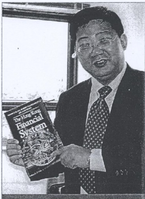
香港作為國際商業及貿易中心，提供了MBA的學習環境，圖為作者展示他的新作。

MBA學位多年來被視為商學院的「鎮店」課程，學生蜂湧而來修讀，以作為加入跨國機構或大商行之門檻，但隨着近幾年經濟和就業市場不景、人口結構老化、課程素質參差和學費成本偏高等因素，已有跡象顯示MBA學位的需求和受歡迎程度已較前遜色。