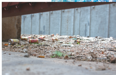
■現址仍是建築空地