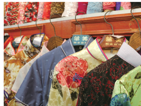
■店內兩側掛滿製作中的旗袍

旗袍之美在於那份古典的東方神韻。旗袍可以是妖艷的花色、清秀的素色、平實的幾何。風情萬種，婉約蘊藉，或是清秀淡雅，全憑穿旗袍的女子各自演繹。