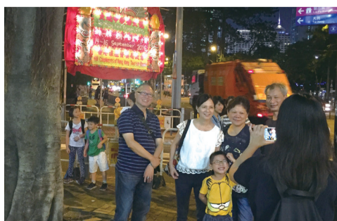
■不少市民前來觀看火龍