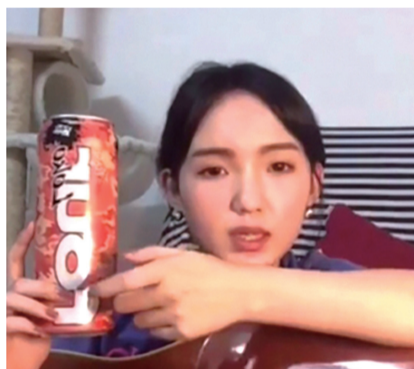
■中國內地有少女飲用 Four Loko 後情緒失控 (網絡圖片)

酒精中毒可分為三個階段，初期為興奮期，患者面色潮紅，頭昏暈眩，情緒較不穩定，難以控制自己；第二是共濟失調期，除初期病徵外，患者亦會出現動作不協調、語無倫次、視力模糊，甚至有嘔心或嘔吐的情況。若患者仍不斷攝取酒精，最後患者便會進入昏迷期，處於昏迷狀態，面色蒼白、體溫降低、心跳亦會加快，甚至可能因為呼吸衰竭而死亡。