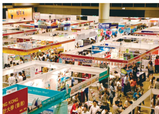
■第19屆香港國際教育展，吸引有意出國升學人數參觀（網上圖片）