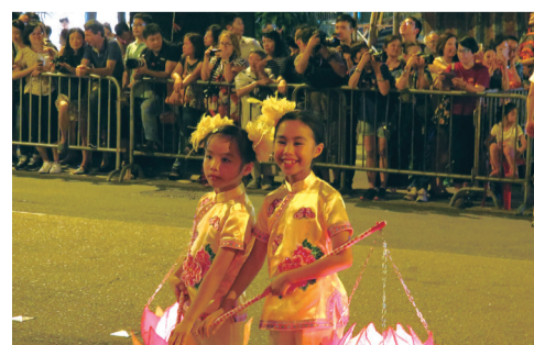
■手捧蓮花燈的小童

今年有主辦單位於灣仔利東街舉行「LED火龍鼓舞迎中秋」，以環保及創新展現舞火龍的另一種風貌。傳統火龍的煙煙撲鼻，新興科技難以取代那種喜慶氛圍，輝哥直言不擔心大坑舞火龍會被取代，這個百年慶典必將香火鼎盛，延續下去。