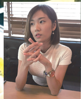
■鮑小姐不會因網上傳言而不吃三文魚生

食客梁先生亦不擔心三文魚有蟲的傳言，但他表示，會留意進食三文魚從哪裡進口，亦會揀選有保證的店舖和餐廳，不會選擇平價食店。