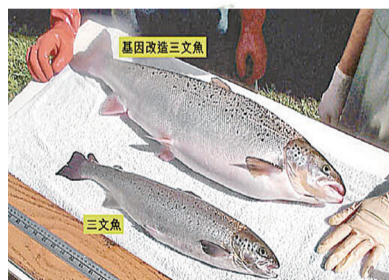
■基改三文魚魚身較大，但料難以引進(網上圖片)