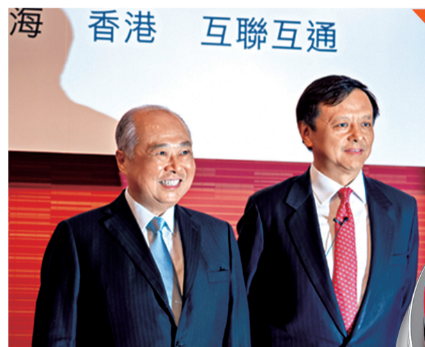
港交所主席周松崗（左）及行政總裁李小加（右）召開記者會