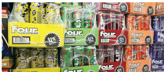
■在上水一帶充斥 Four Loko