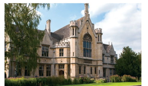
■奧多中學（網上圖片）

學生和師長間除了教學關係外，亦是朋友，老師可以更了解學童的發展和興趣，學生與老師互相信任，減低階級觀念，有利個人發展。