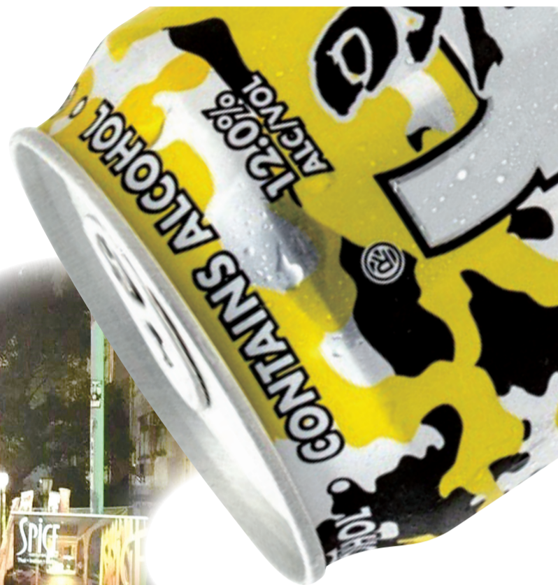
■香港酒吧未有出售 Four Loko

有市民表示，Four Loko 成份不明，來源不明，不應嘗試。這種飲品在民間銷售，最少要像香煙一樣，加上警告字眼，否則應該禁售。另有市民認為，這種飲品可以繼續發售，但大家最好留在家中飲用，以策安全。