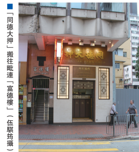
「同德大押」搬往毗連「富德樓」

他稱，本港對歷史建築保育不力，主要原因是香港在維修歷史建築物方面，缺乏人才，政府及建築界應多吸納維修學徒，培養人才。另一方面，政府也需提供更多誘因，令業主願意以換地方式，保育具有歷史價值的建築物。