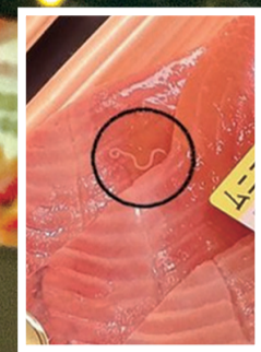
■部份三文魚生含有寄生蟲(圓圈位置)