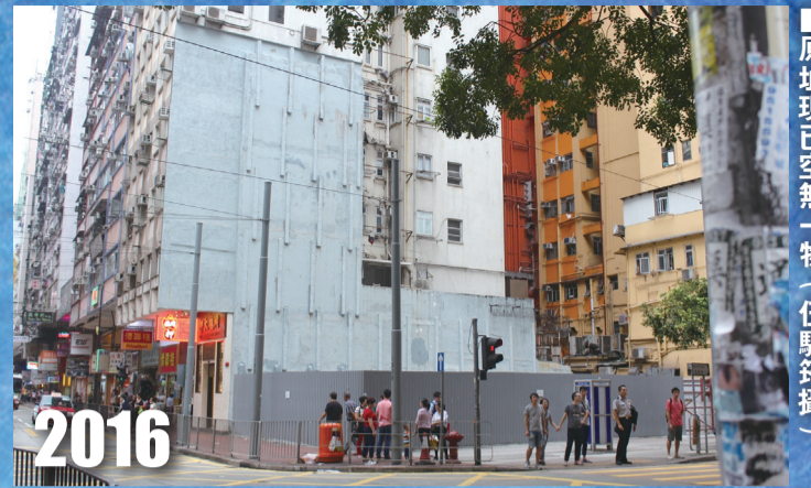
原址現已空無一物