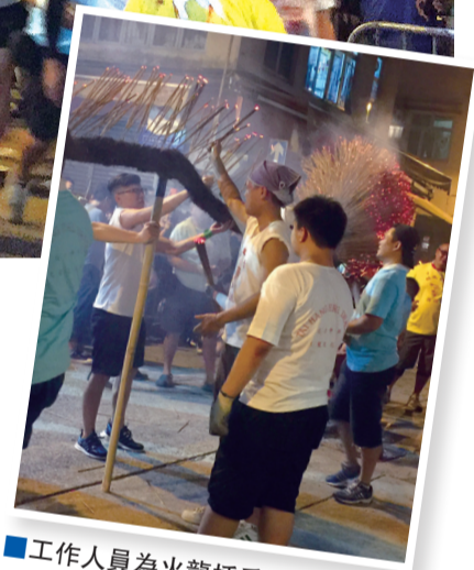
■工作人員為火龍插香