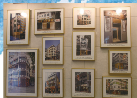
■同德大押內展示多張歷史照片

在「同德大押」毗鄰新中華刀剪廠工作的冼先生表示，「同德大押」應改為博物館，而不是一拆了事，他慨嘆「冇辦法，香港講求商業權利，業主可以自由抉擇。」