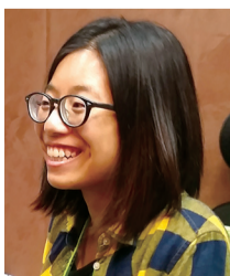
■曾嘗 Four Loko 的市民認為不用禁售