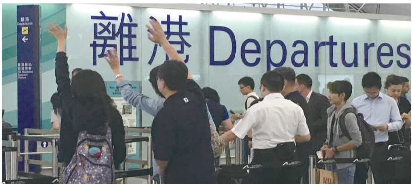
■家長送別子女到外國留學

匯豐報告中，調查訪問了全球15個國家及地區共6241位家長，當中包括396名香港受訪者。結果顯示，高達54%港人願意送子女接受海外大學教育，高踞全球頭三名，遠高於全球平均水平的35%。