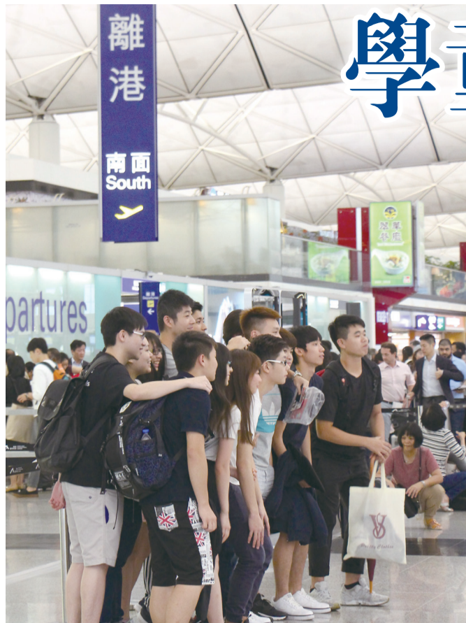
■學生到機場送別出國升學同學

隨著社會發展迅速，很多家長有經濟能力讓子女出國留學。而香港教育制度的缺失，亦成為出國留學的誘因。教育制度爭議不斷，學童壓力「爆煲」，令近期再現留學風潮。根據匯豐銀行所發表的調查報告，高達54%受訪香港家長，考慮將子女送往海外升學，高於全球水平。