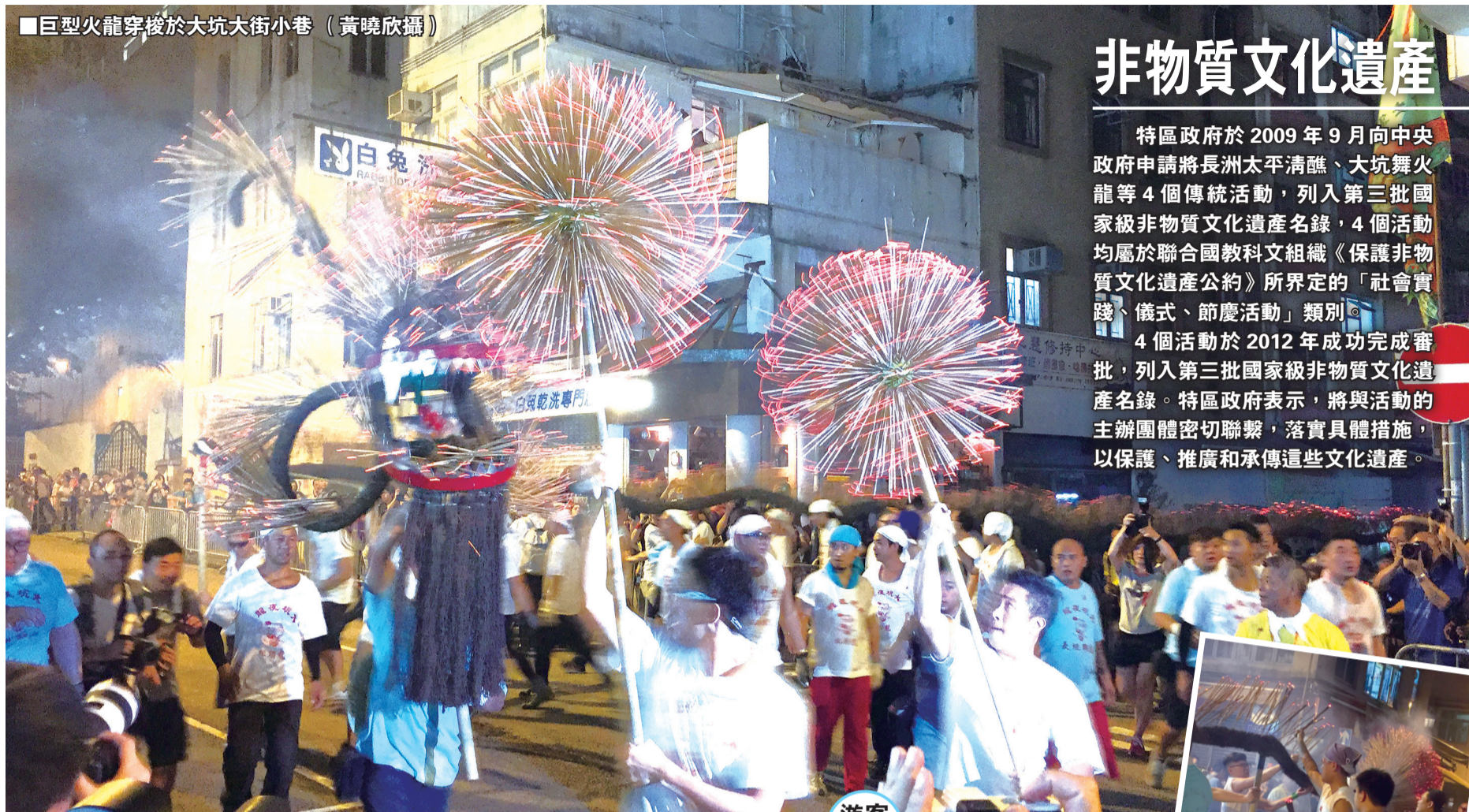
■巨型火龍穿梭於大坑大街小巷

中秋佳節，香港大坑在迎月夜起，上演一連三場舞火龍表演。這項逾百年的傳統慶節活動，在天文台颱風莫蘭蒂可能突襲的預警下，照樣火爆大坑。大批市民、遊客前來捧場，見證在喧天的鑼鼓聲下，絢爛的火龍穿梭於大街小巷，映照萬家燈火，為居民祈福。大坑火龍承傳人及總指揮陳德輝高興地表示「天公好幫我啦」。