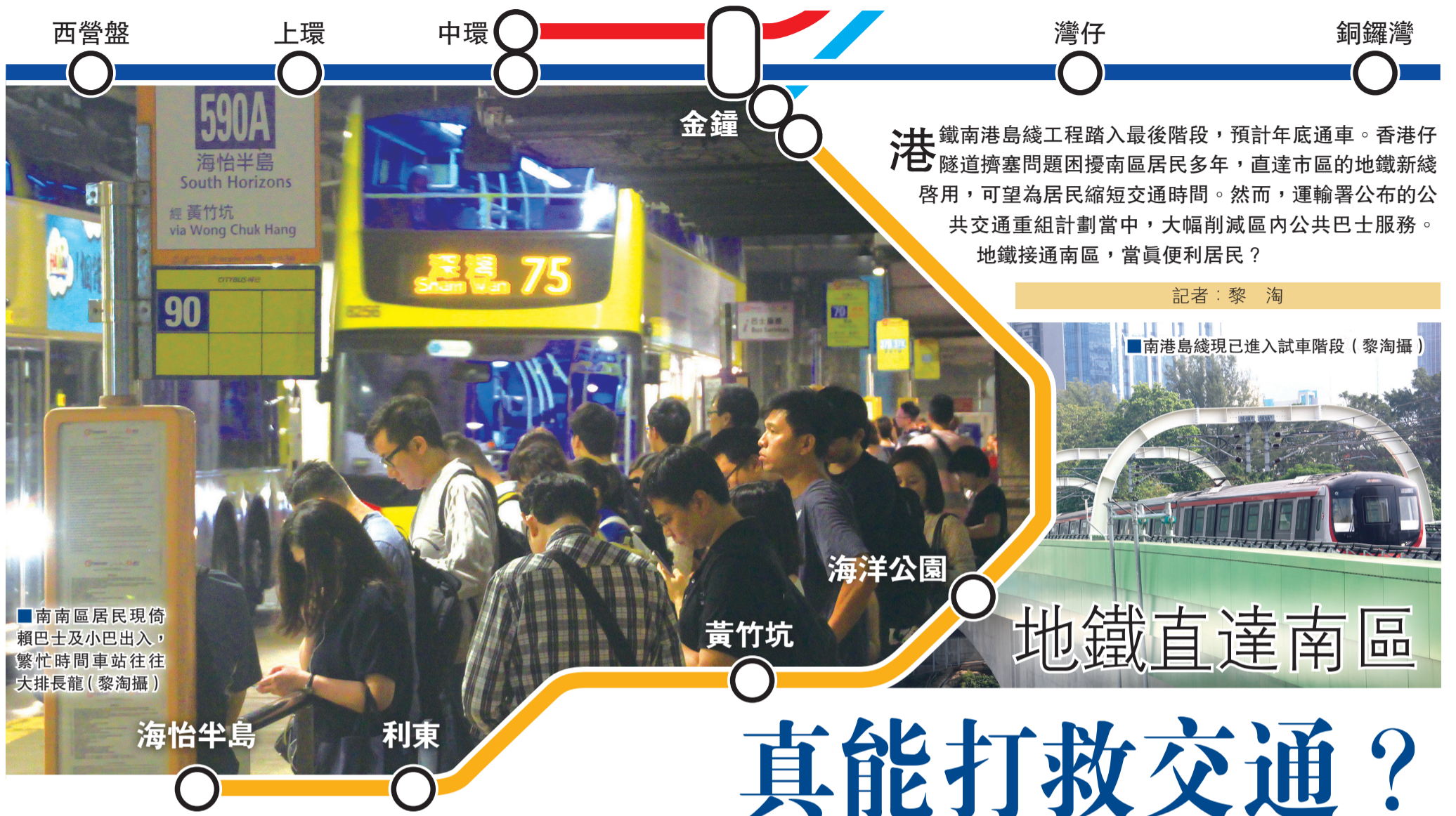
■南南區居民現倚賴巴士及小巴出入，繁忙時間車站往往大排長龍